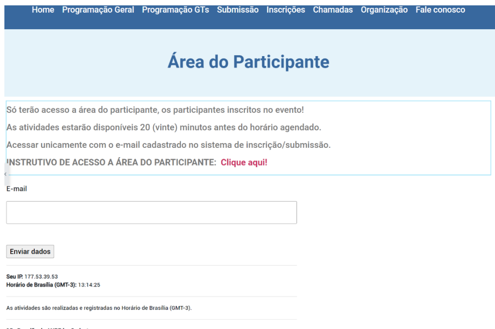
Figura 1 - Exemplo tela de acesso